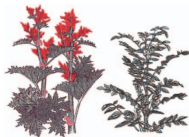
信州大 しんしゅう 黄 おう